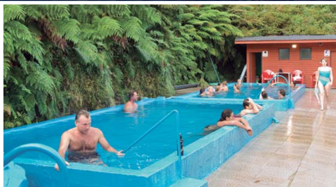
Fiordo de Quitrалco