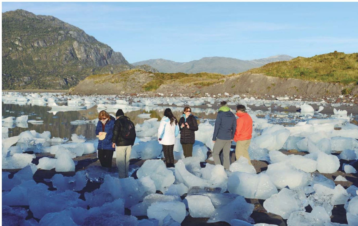
Glaciar Bernal y Glaciar Amalia