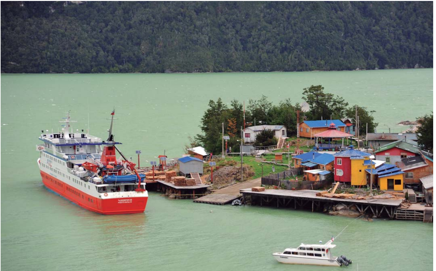
Puerto Edén y Caleta Tortel