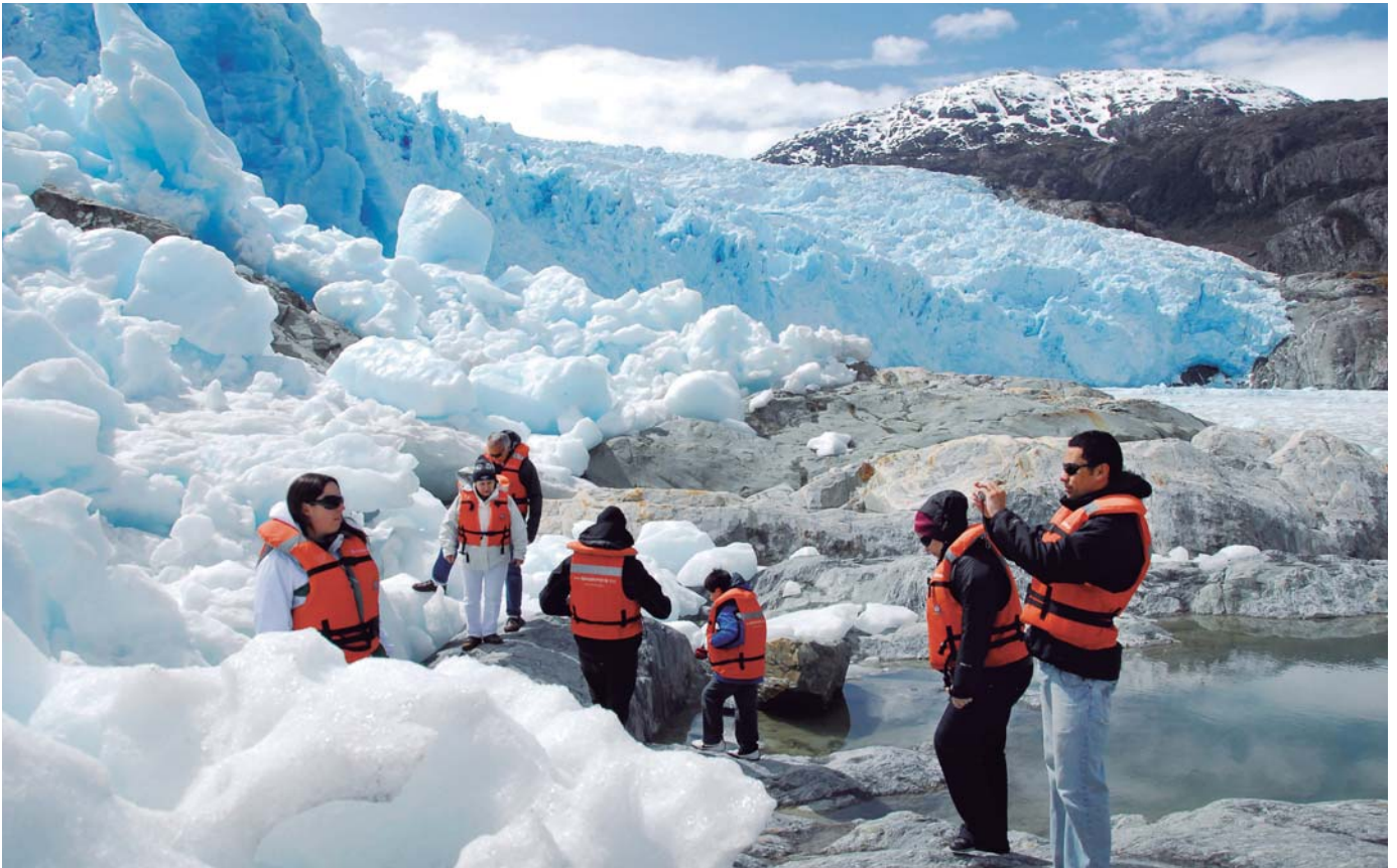
Glaciar El Brujo