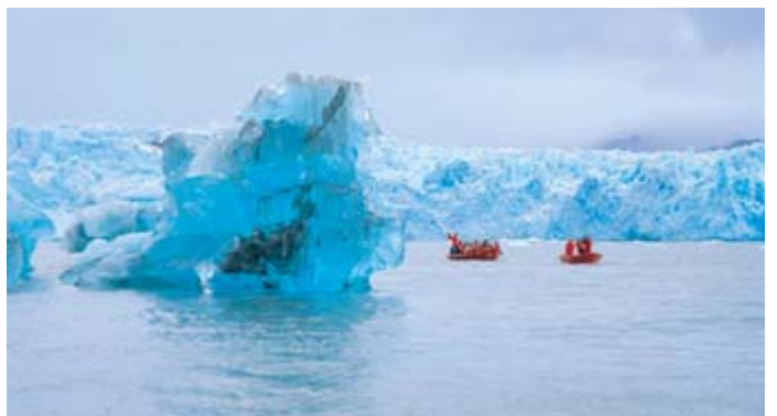
Glaciar Pío XI