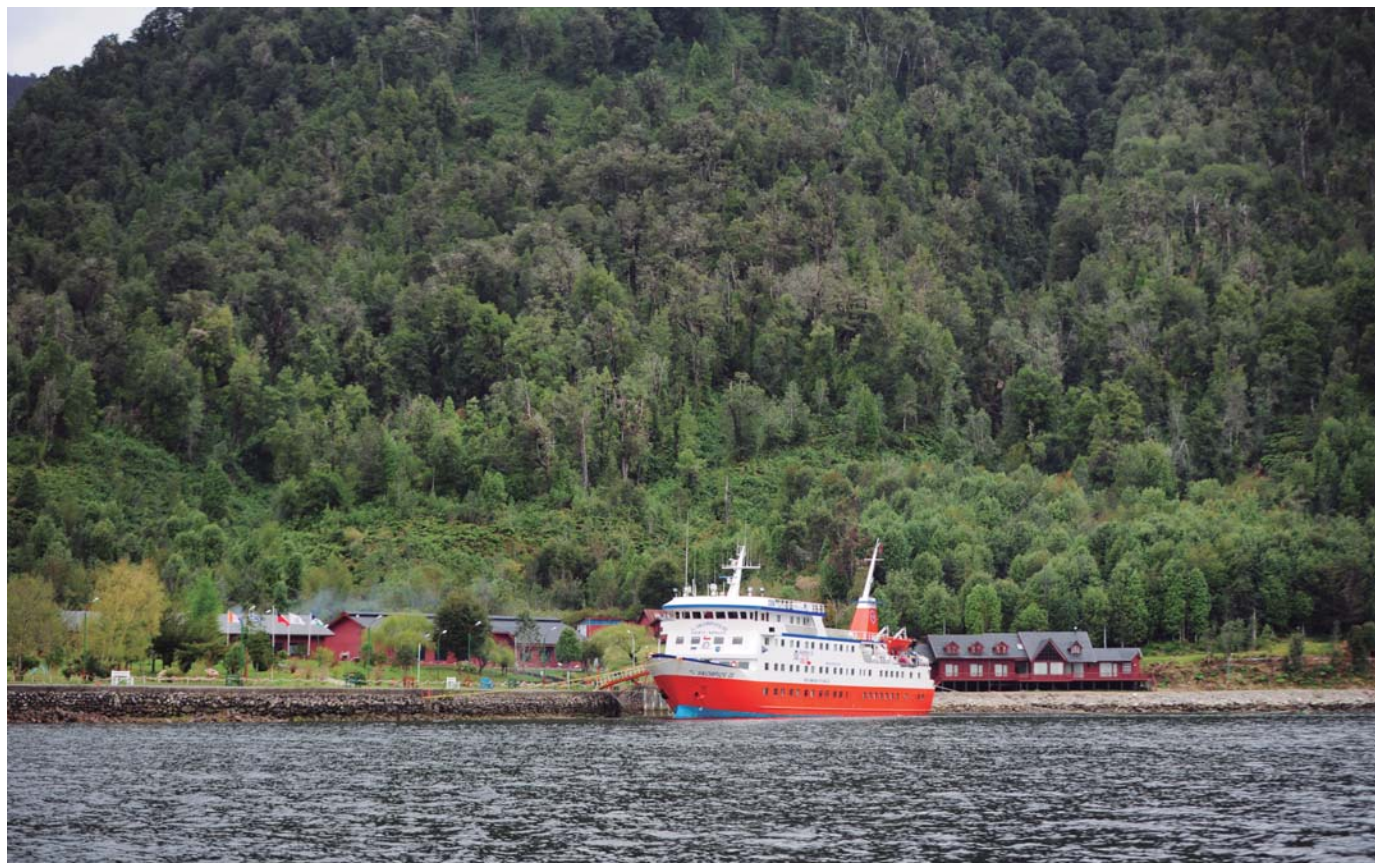
Fiordo de Quitralco